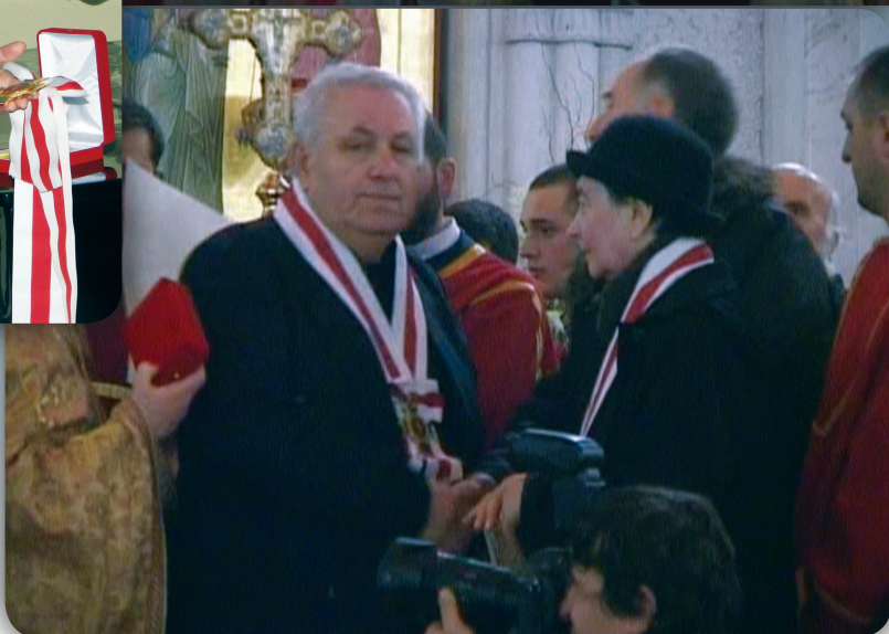
ბიულეტენი გამოდის ცხუმ-აფხაზეთის მიტროპოლიტ დანიელის (დათუაშვილის) ლოცვა-კურთხევით 2007 წლის ივლისიდან