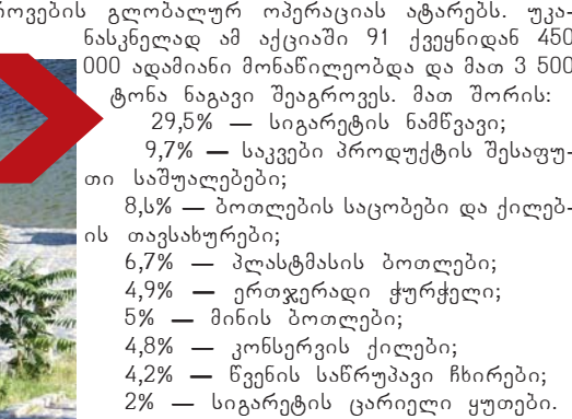
გვერდით მოამზადა მაკა ლლოკონენა

ოკეანეების დაბინძურებასთან ბრძოლის ეკოლოგიური ორგანიზაცია ყოველი წლის სექტემბერში პლაჟებიდან ნაგვის შეგროვების გლობალურ ოპერაციას ატარებს. უკანასკნელად ამ აქციაში 91 ქვეყნიდან 450 000 ადამიანი მონაწილეობდა და მათ 3 500 ტონა ნაგავი შეაგროვეს. მათ შორის: 29,5% — სიგარეტის ნამწვავი; 9,7% — საკვები პროდუქტის შესაფუთი საშუალებები; 8,5% — ბოთლების საცობები და ქილები თავსახურები; 6,7% — პლასტმასის ბოთლები; 4,9% — ერთჯერადი ჭურჭელი; 5% — მინის ბოთლები; 4,8% — კონსერვის ქილები; 4,2% — წვენი საწარმოები ჩხირები; 2% — სიგარეტის ცარიელი ყუთები.