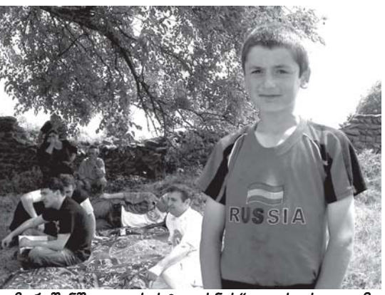
თამარაშენში „ვეფხისტყაოსნის“ კითხვის დღეზე

„პირველ ქართულ უნივერსიტეტში მოღვაწე ქართველი მეცნიერები წლების განმავლობაში შეისწავლიდნენ ოსურ ენასა და კულტურას. თსუ-ის პროფესორთა საბჭოს 1918 წლის სხდომის ოქმში ხაზგასმით იყო აღნიშნული, რომ პირველმა ქართულმა უნივერსიტეტმა დაარსებიდან მესამე თვეს საგანგებო სხდომა დაუთმო კავკასიური ენების — გამორჩეულად კი ოსური ენის სწავლებას. მიუხედავად იმისა, რომ დაარსების პირველ ეტაპზე უნივერსიტეტი უამრავი პრობლემის