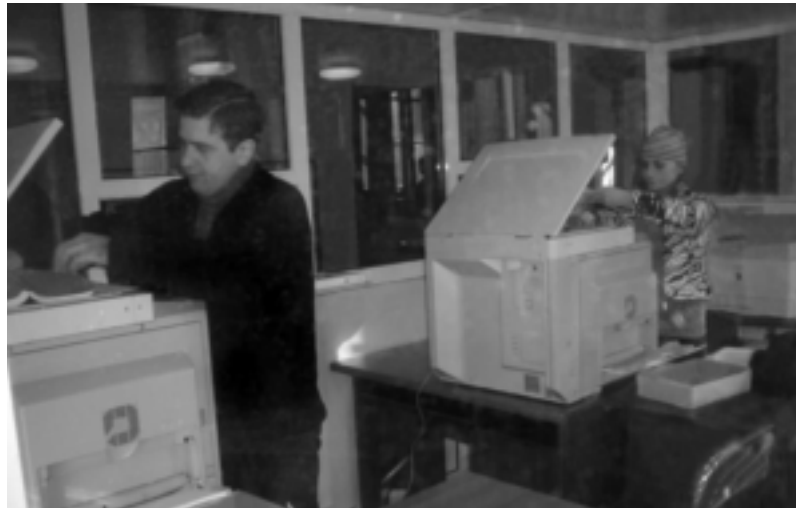
ასლთა გადამრავლების ახალი ჯიხური მეორე კორპუსში

• ბრძანებები გამოკრულია თვალსაჩინო ადგილას თსუს ყველა კორპუსსა და სტრუქტურულ ქვედანაყოფში.