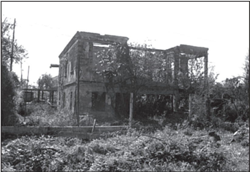
გულრიფში. სამოთხიდან გაძევება