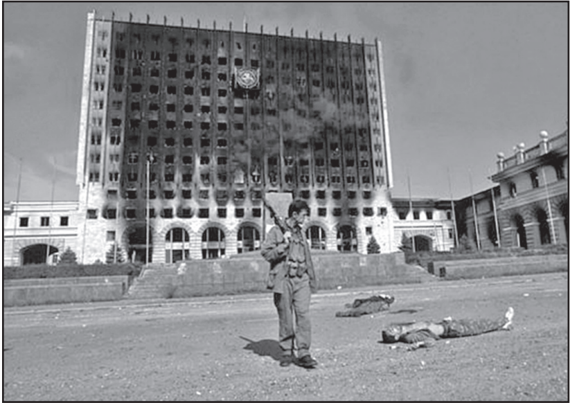
სოხუმი. მთავრობის სასახლე