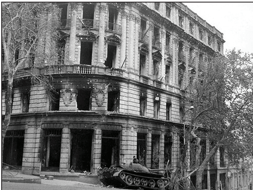
თბილისი, ძმათამკვლელი ომი. სასტუმრო „თბილისი“; საქართველოს ტელევიზიასთან