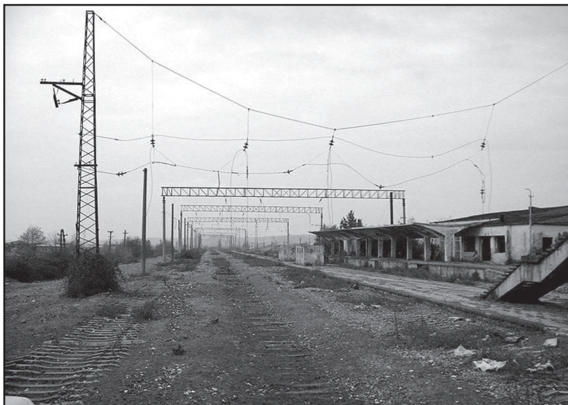
გალი. რკინიგზის სადგური