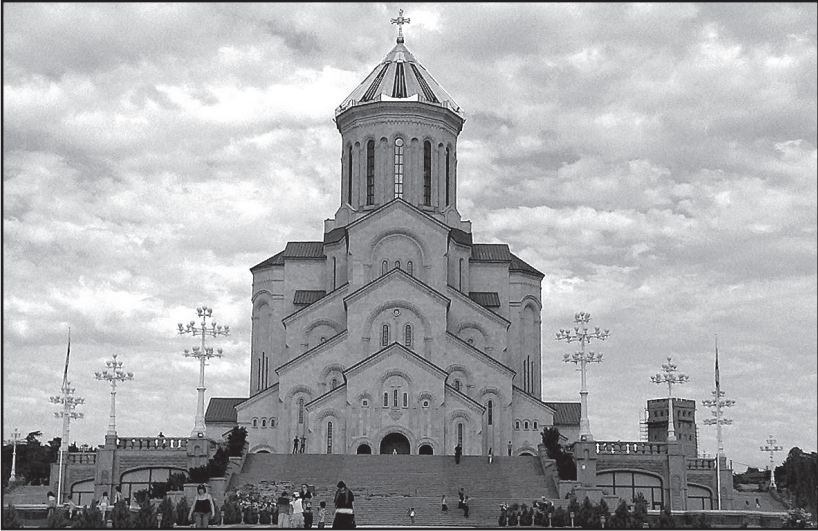
თბილისი. წმიდა სამების საკათედრო ტაძარი