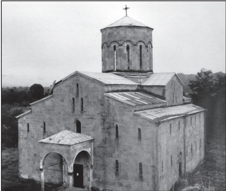
აფხაზეთი. მოქვის ტაძარი