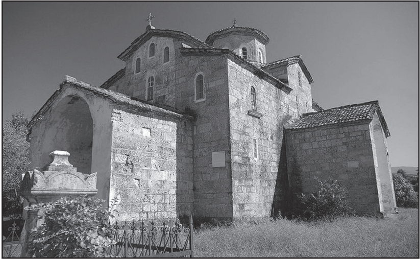
აფხაზეთი. ლიხნის ტაძარი