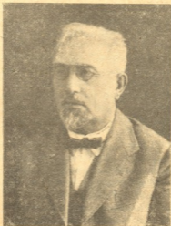
ალ. ჯაბადარი (1862—1933)

სამ წელიწადზე მეტია, რაც ჩემი მეგობრები მიჩვენებენ—ნელ-ნელა ვწერო ჩემი მეგობრები. ჩემს შეკითხვაზე, ჩემს მეგობრებს თუ რა ინტერესი ექნება, —ყოველმა მათგანმა მომაგონა ზოგიერთი ამბავი და ეპიზოდი, რომელთაც საზოგადოებრივი ხასიათი აქვთ და ასე თუ ისე აშუქებენ იმ ხანას, როდესაც მე ვცხოვრობდი. თითქო კიდევ დამარწმუნეს, რომ შეიძლება ზოგიერთი ადგილები ჩემი ნაამბობისა მომავალში მართლა გამოადგეს ჩვენი საზოგადოებრივების შემართანეს და შევლევას.