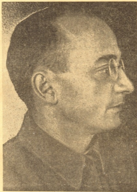
ახ. ლაჭინცი შვილია

გაძლიერებულია მხატვართა კავშირის მატერიალურ-სამეცნიერო ბაზის გადარეცხვა ნაციონალური გალერეა გამოფენებისათვის და სოციალისტური მხატვრების ციხეში ეწყობა ხელოვნების მუზეუმი.