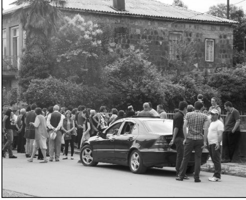
2 ივლისს, ქ. ოზურგეთის №2 საჯარო სკოლაში გურიის რეგიონის აბიტურიენტებმა ეროვნული გამოცდების ჩაბარება დაიწყეს. პირველი გამოცდა ქართულ ენა და ლიტერატურაში იყო.

ჩვენ გამოცდის შემდეგ რამდენიმე აბიტურიენტს გაეცხადებოდა: