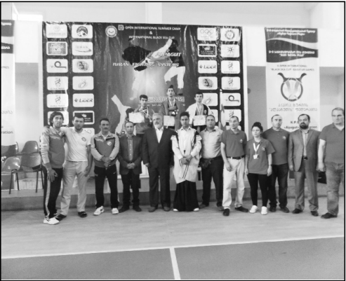
ალიონი. 25-27 ივნისს ქ. ოზურგეთის სპორტის სასახლეში ჩატარდა შავი ზღვის ღია პირველობა აღბავუტში (სრული კონტაქტური კარატე). აღმოსავლური ორთაბრძოლის (აზერბაიჯანული ვარიანტი) შედის კონტაქტური კარატე, - K-1 კიბოქაიანი, M-1 ბრძოლა წესების გარეშე. ოზურგეთში ჩამოვიდნენ აზერბაიჯანის და ირანის ნაკრები გუნდები. საქართველოდან გურიის აღბავუტის ფედერაცია მონაწილეობდა ამ ტურნირში.

25 ივნისს მოეწყო ტურნირის გახსნა და ჩატარდა სემინარი, ხოლო 27 ივნისს გაიმართა ორთაბრძოლა.