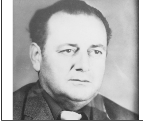
ვფიქრობ, როგორ დავწერო შენი მოსაგონარი, ვფიქრობ...

მიყვარხარ, მიყვარხარ უსამანო სიყვარულით!